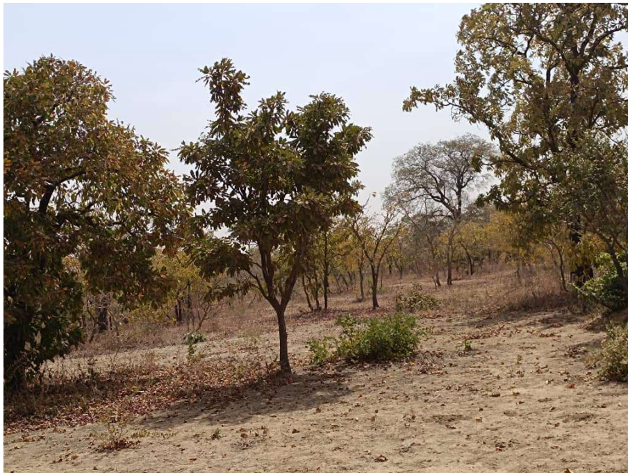
Photo 4: Végétation sur le site