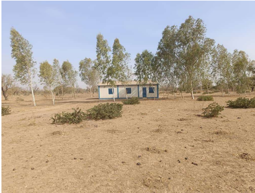
Photo 3: Vue d'une église sur le site