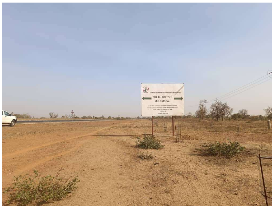
Photo 5: Signalisation du site du projet